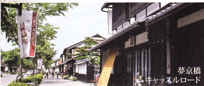
夢京橋 キャッスルロード

彦根城は、日本の滋賀県彦根市金亀町にあった城です。江戸時代および1869年（明治2年）の版籍奉還後から1871年（明治4年）の廃藩置県まで彦根藩の役所が置かれました。天守、附櫓及び多聞櫓は国宝、城跡は国の特別史跡かつ琵琶湖国定公園第1種特別地域となっています。