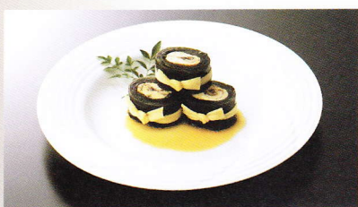
あゆや さと 鮎家の郷

「鮎家の巻物」や琵琶湖佃煮を販売する「楽市売店」をはじめ、鮎料理・鴨料理の「鮎鴨亭」、びわ湖レストラン「比良暮雪」など、鮎家の創作料理を取りそろえ皆様のお越しをお待ちしております。琵琶湖湖畔の風景とともに、「びわ湖グルメリゾート」をお楽しみください。