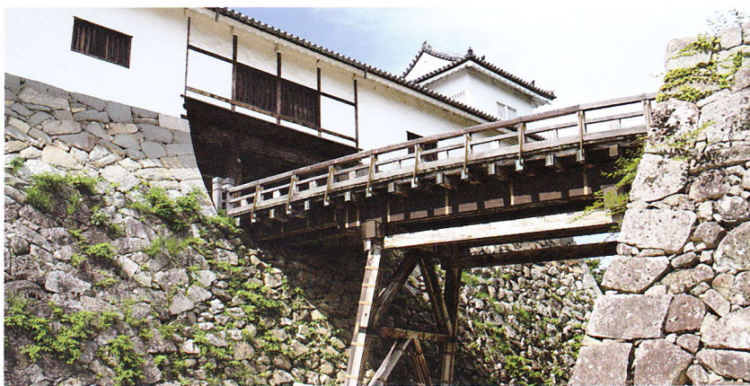
ひこねじょう 国宝 彦根城

彦根城は、日本の滋賀県彦根市金亀町にあった城です。江戸時代および1869年（明治2年）の版籍奉還後から1871年（明治4年）の廃藩置県まで彦根藩の役所が置かれました。天守、附櫓及び多聞櫓は国宝、城跡は国の特別史跡かつ琵琶湖国定公園第1種特別地域となっています。