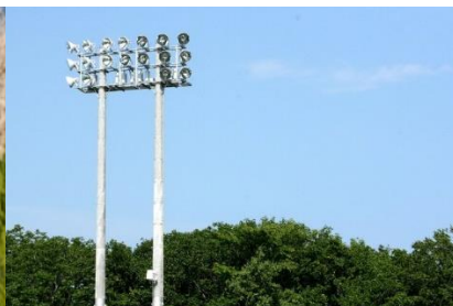
スポーツ施設の照明