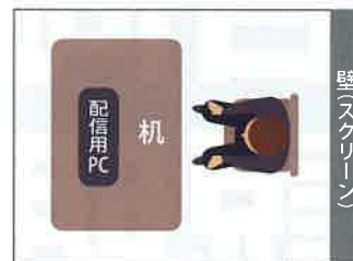
※セッティングイメージ

※著作権や肖像権等の確認が必要な画像や動画資料については各参加社様においてご確認下さい。