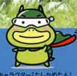
キャラクター「たしかめたん」