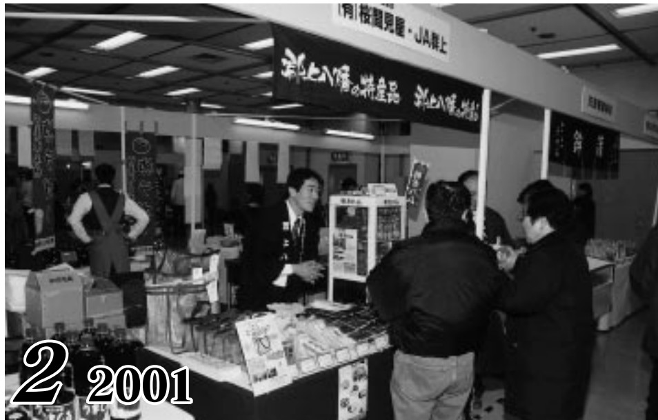
岐阜の伝統をPR ~東京・全国地場産フェア'01~ (記事6頁)

岐阜県 中小企業団体中央会 岐阜市藪田南5丁目14番53号 岐阜県県民ふれあい会館12階 毎月15日発行 購読料 年間1,500円(1部125円) 発行人 森本安彦 事務局直通電話 管理調整 058-277-1100(代) 広報振興 058-277-1101 組織指導 058-277-1102 調査労働 058-277-1103 情報企画 058-277-1104 事務局FAX番号 058-273-3930