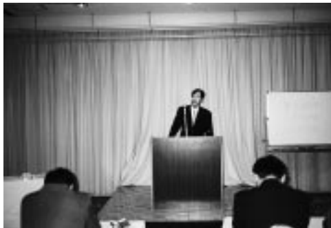
青年中央会・研修会

「21世紀を生き抜く中小企業の発想と戦略」～新世紀の経営革新と着眼点～をテーマに(株)日本能率協会コンサルティングの