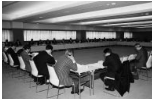
情報連絡員全体会議

五十社が加入。全国組織は、百二十三組合千六百社あり、イントラネット・IT活用を積極的に進めている。荷主にも末端にも加入していただきたい。