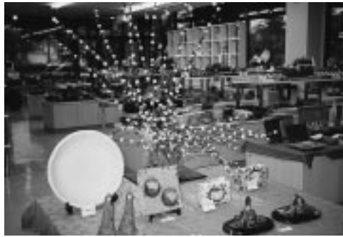
美濃焼と飛騨花もち

買う楽しみだけでなく、創る楽しみもあり、レジャーを兼ねて出かけられることをお勧めし