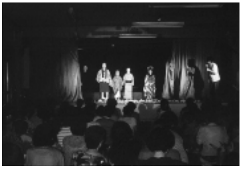
駄知の『子供歌舞伎』

て開催し、好評を博した昨年に続き二回目。役者は愛知県作手村の子供達で、当日は約百三十人の観客が見物に訪れ、子供達の名役者ぶりを楽しんだ。