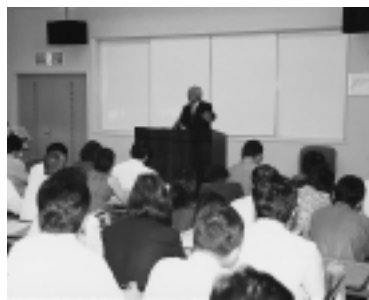
研修で講師を務める社会長

九月四日には県職員を対象とした地方自治大学校 監督者係長級「研修」で、中部コンビューター(株)代表取締役相談役として講師を務めた、同大学の講堂で、「望ましい公務員のあり方」と題し、「公務員だからこそ民間に接触し業界の人の話を傾