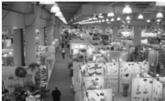
ニューヨーク・インターナショナル・ギフト・フェア

毎年1月と8月の2回開催されるのだが、このフェアへの出展希望は多く、公式サイト(www.nyigf.com)で、空きスペースのための順番待ちをあらかじめ知らせ