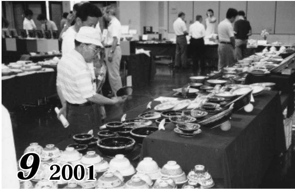
陶磁器新作展示会 ~土岐・瑞浪~ (記事・2頁)