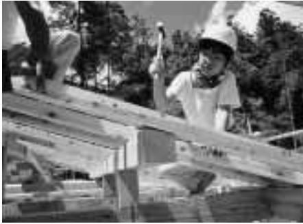
大工体験セミナーでの建築実習

県内外から応募のあった大工志望者五十五人の中から、県内や愛知、千葉、広島などの二十二人が選ばれ、年齢層は中学三年生から三十四歳までと幅広い。職業も様々で女性も八人いた。開講初日は町内のひのき製材