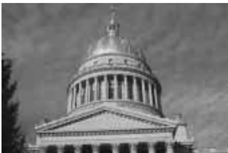
州政府庁舎。就職先として人気が高まっている。

安なこと」の調査結果で、多くのアメリカ人は、将来のことに不安を抱えており、例えば「会社が倒産したら、これからの時代では転職先もみつかるとは限らない。」と悲観的に考え、家族をどうやって養っていくかということを危惧しているようである。これは、9・11テロの後で心理的な要因やテロリスト問題などの先行き不透明さもある程度影響していると思われるが、職業に関しては、できれば定年まで同じ会社で働き、その後も平穏な生活を送りたいという「安定志向」のアメリカ人が増えてきているのも事実のようである。