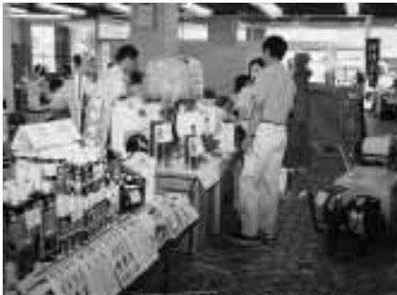
農機具等の秋物商品展示即売会

三日間の建築実習では、同組合の組合員である大工の指導により、二班に分かれ組合の倉庫とバターゴルフ場の管理棟の建て前を行った。関係者は、過去のセミナーで付知町の大工になった受講生も数名います。今回のセミナーからも付知の大工が生まれればと、受講生らが道具を振るい、真剣に取り組む様子を見ながら期待を寄せていた。