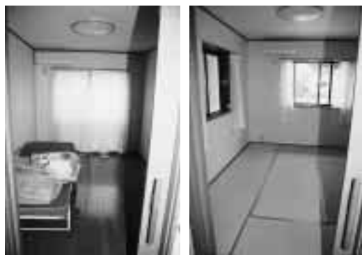
6畳の居室を6室用意。洋室(左)と和室(右)。

建物は木造平屋建てで、9.94㎡(6畳)の洋室・和室がそれぞれ3室の計6室で、6名までの入所が可能です。廊下や浴室、お手洗いには手すりが施され、段差のないバリアフ