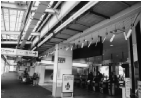
風に揺れる美濃焼風鈴

多治見市内の各陶磁器工業協同組合(高田・市之倉・滝呂)が、毎年交代で実施し、同市の夏の風物詩となっている美濃焼の風鈴が、JR多治見駅に飾り付けられ、涼しげな音色を響かせている。