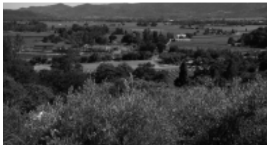
事業予定地のナババレー遠景