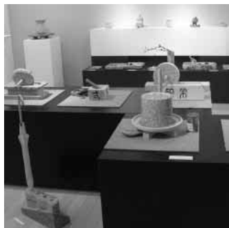
アクティブGでの作品展

る石と語る」をテーマに、石の持つ魅力を表現し、自然が作り出す美の造形を披露した。