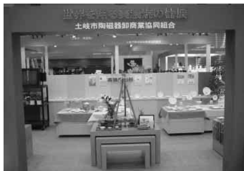
世界を翔る美濃焼の器展