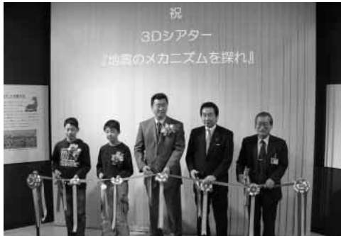
贈呈式でのテープカット