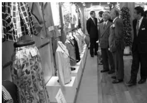
リトル問屋街に最新作を展示

「問屋街再発見」をメインテーマに百五十社が参加し、商品展示ゾーン「リトル問屋街」に春・夏向けの最新作を並べた。 このリトル問屋街とは、問屋街を東部・中部・西部の三つの地区に分けてそれぞれで商品を