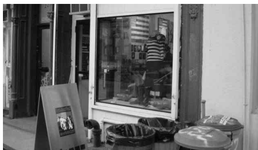
グルーコレクティブのお店(外観)