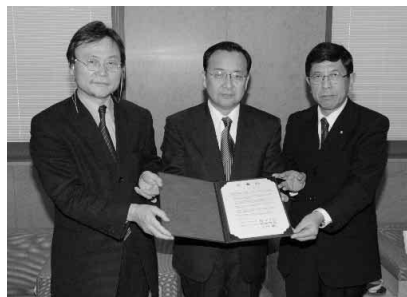
三者が協定書に調印

企業との間で、具体的な商談の話が進むなどの成果があがったため、ITを地域産業の発展と人材育成に有効に活用するため、今後も三者間で相互連携していくことで合意した。