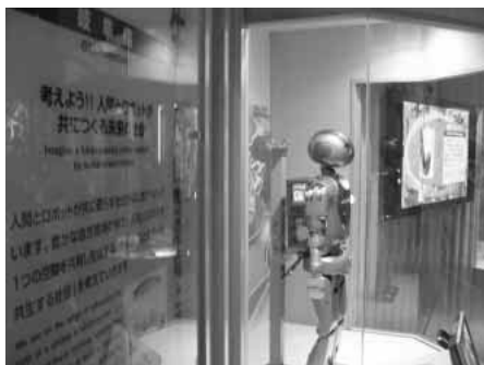
中部千年共生村／岐阜県ブース