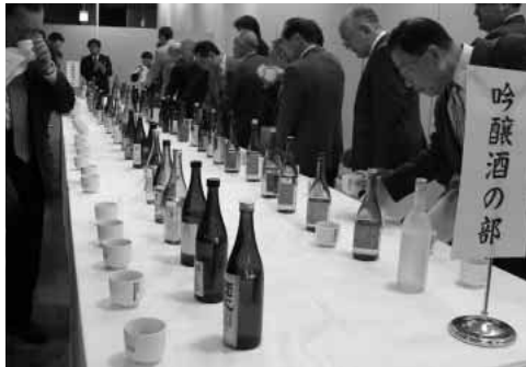
新酒の出来栄をチエック

【県知事賞】 吟醸酒「白真弓」(蒲酒造場) 純米醸造酒「ヒカリ百春」(小坂酒造場) 本醸造酒「富久若松」(池田屋酒造) 【県議会議長賞】 吟醸酒「美濃天狗」(林酒造店) 純米醸造酒「女城主」(岩村酒造) 本醸造酒「御代桜」(御代桜醸造)