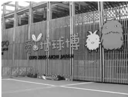
愛・地球博／長久手会場